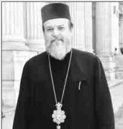
Preasfințitul Vincențiu, noul episcop ales al Episcopiei Sloboziei și Călărașilor

Preasfințitul Părinte Corneliu, noul episcop ales al Episcopiei Hușilor - citat de Ziarul Lumina - după ce a mulțumit lui Dumnezeu, a declarat: „Tuturor credincioșilor din Episcopia Hușilor le promit și le făgăduiesc dragostea și rugăciunea mea, în același timp dorind ca pe toți să-i asigur de purtarea mea de grijă pentru sufletul fiecăruia, pentru că misiunea unui episcop este în primul rând de a păstra dreapta credință și de a arăta credincioșilor calea care este Hristos Dumnezeu cel Întrupat, Cel care a biruit moartea și a înviat