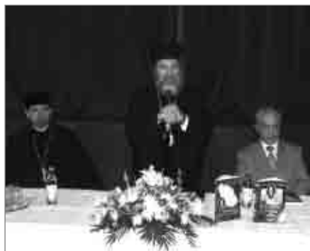
Programul manifestărilor din cadrul Zilelor Episcop Melchisedec Ștefănescu a inclus lansări de carte, conferințe, concerte ș.a.m.d.

Zilele „Episcop Melchisedec Ștefănescu“ s-au încheiat, luni, 18 mai, la Școala nr. 8 din Roman, cu sfințirea și inaugurarea Centrului de zi pentru copii „Melchisedec Ștefănescu“. (Pr. Cornel PAIU)