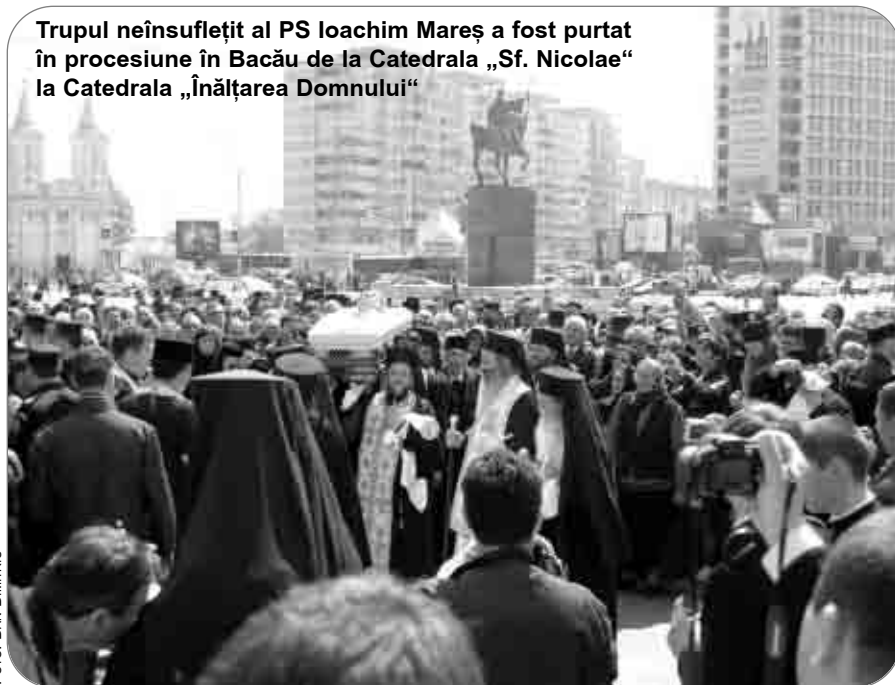
Trupul neînsuflețit al PS Ioachim Mares a fost purtat în procesiune în Bacău de la Catedrala „Sf. Nicolae“ la Catedrala „Înălțarea Domnului“

Într-adevăr, catedrala noastră este, până la ora actuală, cel mai mare edificiu ecleziastic din întreg spațiul ortodox românesc. Dar nu acest fapt este cel mai important. În biserică,