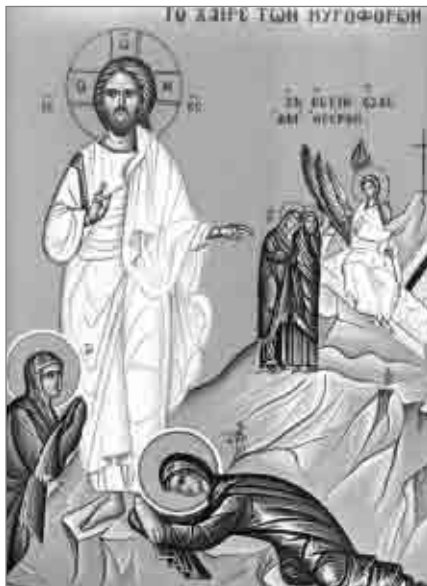
Primii martori ai Învierii Mântuitorului au fost femeile mironosițe

Tot Sfântul Grigorie Palama spune că evangheliștii relatează în chip ascuns faptul că Domnul S-a arătat întâi Maicii Sale. Nu se spun în chip limpede acestea pentru a nu fi adusă ca martoră