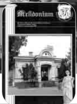
PS Arhiepiscop-vicar Ioachim Băcăuanul a binecuvântat apariția revistei Melidonium a Bibliotecii Municipale din Roman (foto medalion)