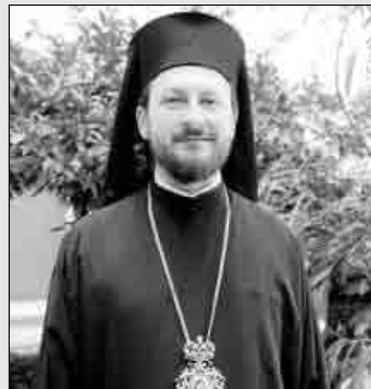
Preasfințitul Corneliu, noul episcop ales al Episcopiei Hușilor

Ceremonia de întronizare a Preasfințitului Episcop Corneliu, noul chiriarh ales al Episcopiei Hușilor, va fi oficiată de Înaltpreas-