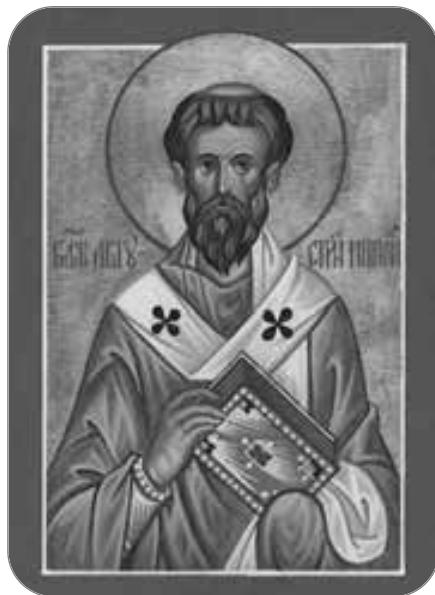
Fericitul Augustin (354-430)

Pomenit de Biserica Ortodoxă în fiecare an pe 15 iunie, Fericitul Augustin este unul dintre cei mai importanți teologi și filosofi creștini, a cărui operă „a modificat substanțial gândirea europeană”, ea constituind, în același timp, o punte de legătură între filosofia antică și cea medievală. Viața și opera sa au fost izvoare de inspirație pentru teologii din toate timpurile. A fost un mare teolog, „o figură gigantică a literaturii creștine”, așa cum îl numește I. G. Coman.