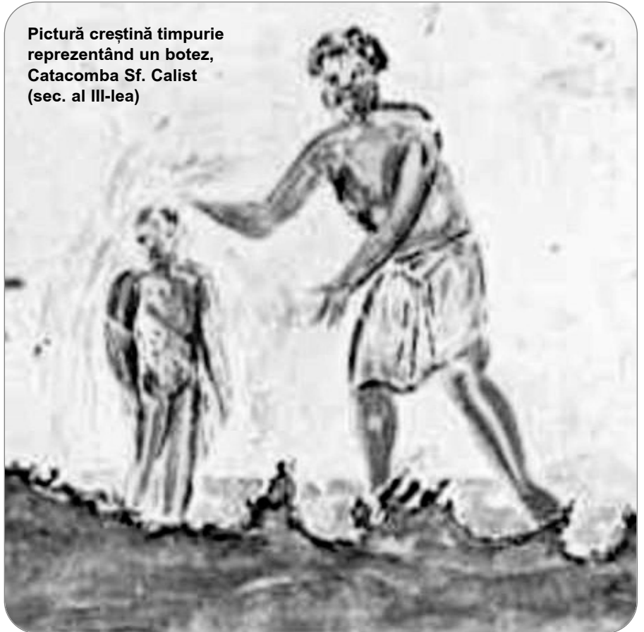
Pictură creștină timpurie reprezentând un botez, Catacomba Sf. Calist (sec. al III-lea)

prin care primitorii lui se deosebeau ca popor al lui Dumnezeu de neamurile păgâne. 4