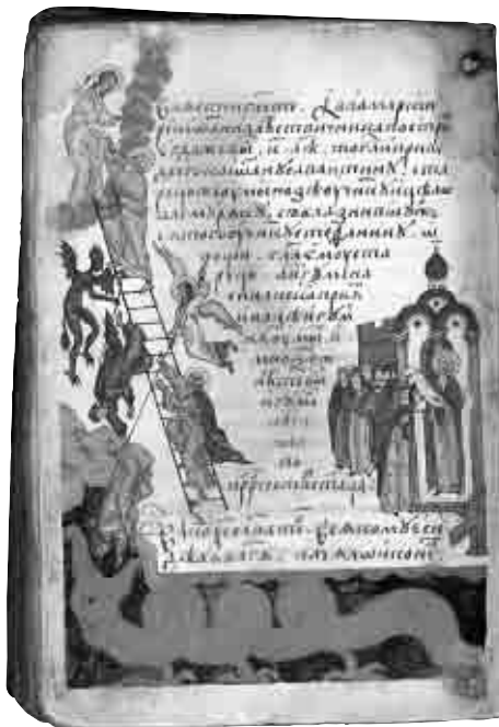
Miniatură dintr-un manuscris rusesc din anul 1560

În cea de-a patra duminică a Postului Mare, se face pomenirea Sfântului Ioan Scărarul, care a