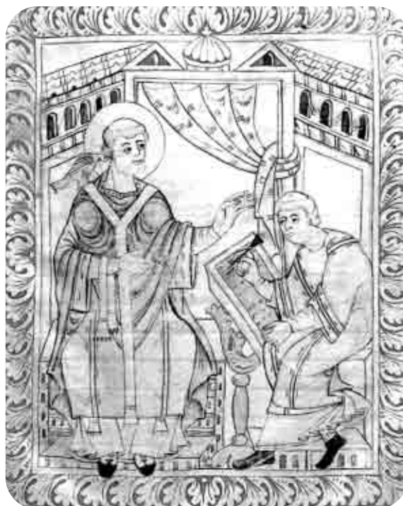
Sfântul Grigore dictând, imagine din Antifonarul de la St. Gallen. Liturgia Darurilor mai înainte sfințite este atribuită Sfântului Grigorie cel Mare, papa Romei, numit și Dialogul