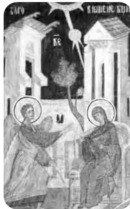
Bunavestire, frescă din Catedrala arhiepiscopală „Sf. Cuvioasă Parascheva“ din Roman

Postul Mare stă sub semnul învierii Domnului din morți. Dezideratul și speranța cele mai intime ale celui ce trece prin Păresimi este primirea darului Învierii în Împărăția cerurilor. Chiar dacă Învierea a fost un eveniment unic, consemnat istoric și va fi pentru noi o certitudine în Eshaton, ea este, de asemenea,