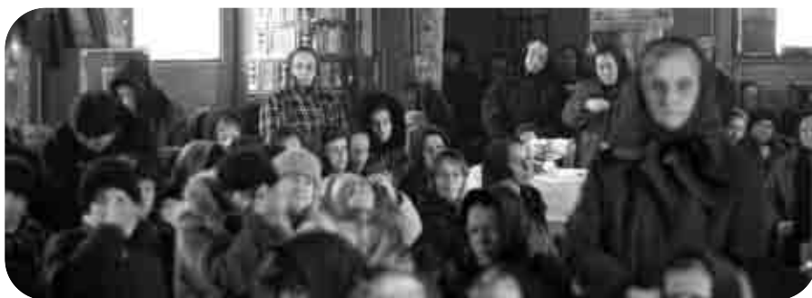
Cu prilejul hramului, la Biserica închinată Sfântului Simeon Noul Teolog din comuna băcăuană Mănăstirea Cașin, a fost oficiată Sfânta Liturghie a Darurilor mai Înainte Sfințite, cu participarea multor credincioși